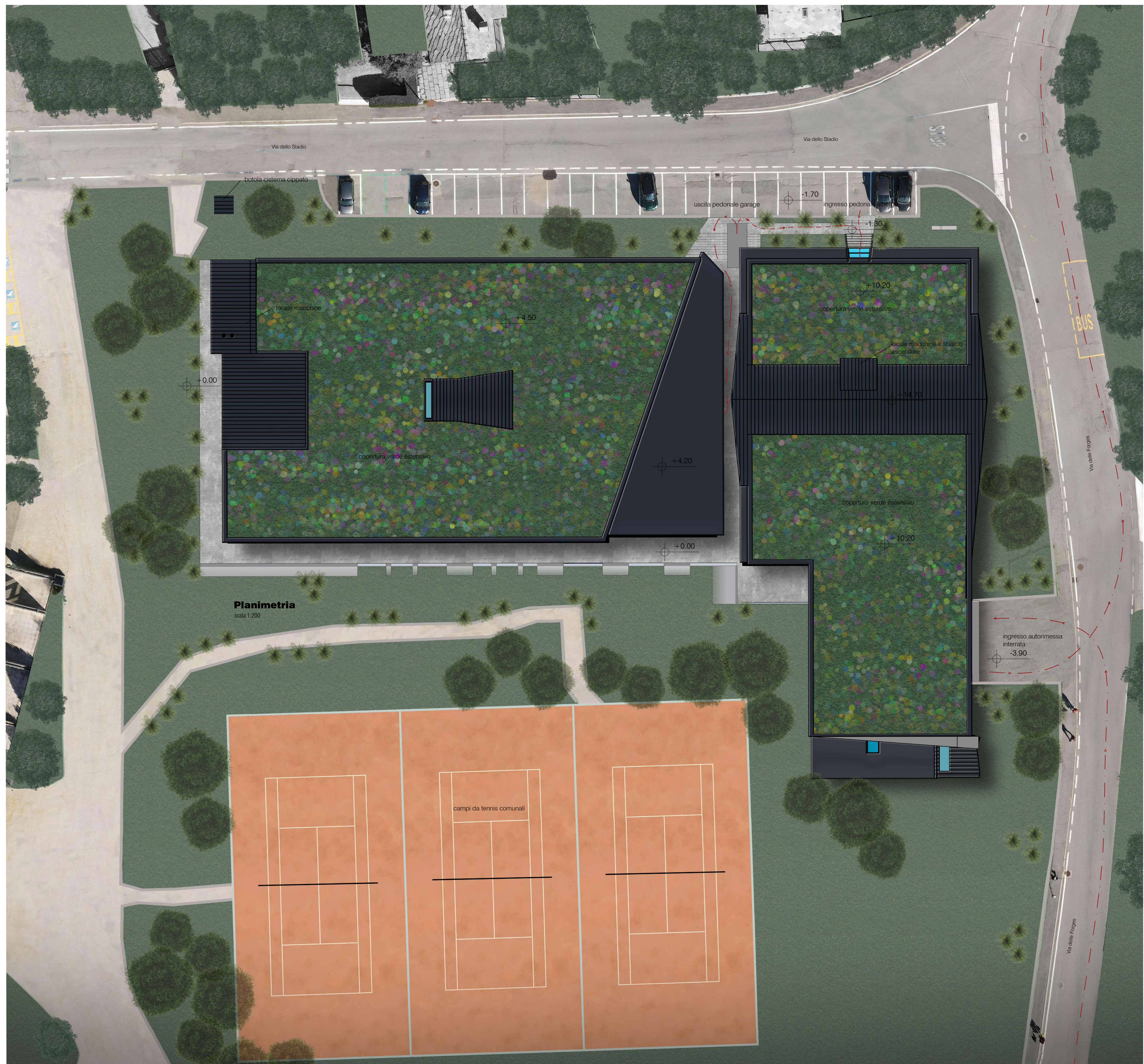
Planimetria scala 1:200